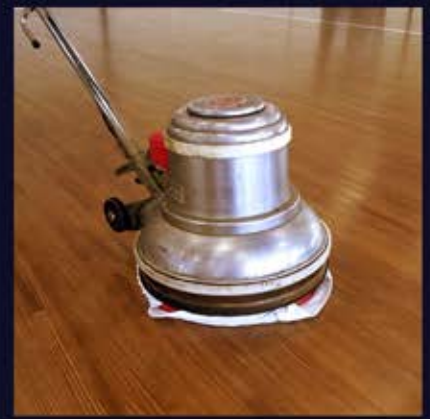
ポリッシャーにウエスを装着する (パッドは柔らかいもの)