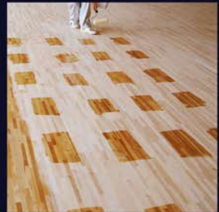
間隔をあけてオイルを塗布