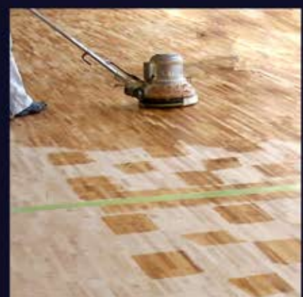
ポリッシャーを使い塗り広げる